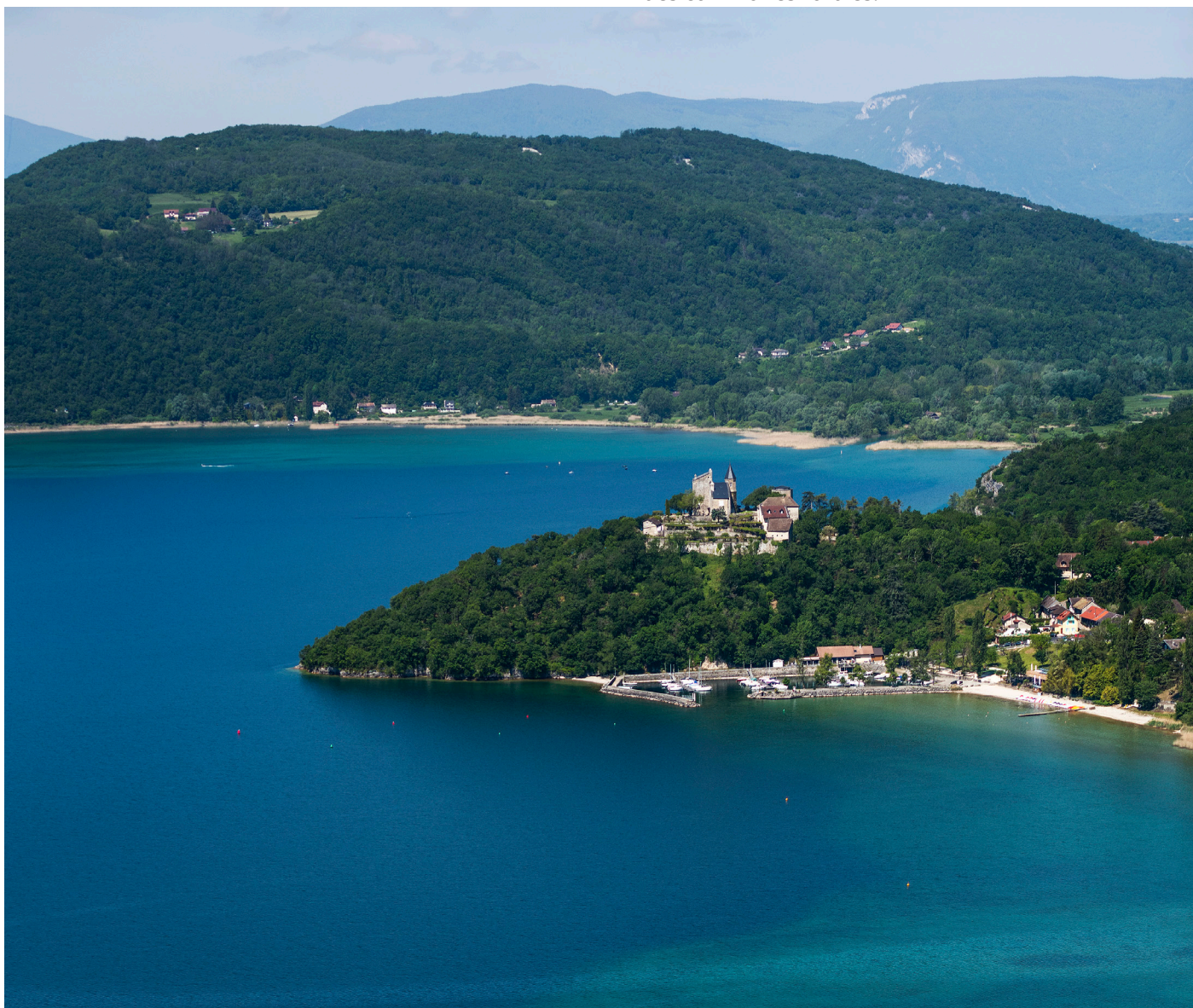
Lac du Bourget - Cap des Séselets

Le nouveau projet de SCoT entend prendre pleinement compte des effets de l'influence ancienne et de l'agglomération franco-genevoise sur la dynamique de croissance du secteur Nord. Il définit une trajectoire de croissance prévisionnelle de 1,35% répartie autour de cinq niveaux d'armature. L'objectif de cette répartition consiste à consacrer le développement d'un axe métropolitain allant de Grésy-sur-Aix à Montmélian, de conforter la structuration de pôles d'équilibre et de proximité en dehors de cet axe et enfin, de maîtriser la croissance des communes rurales.