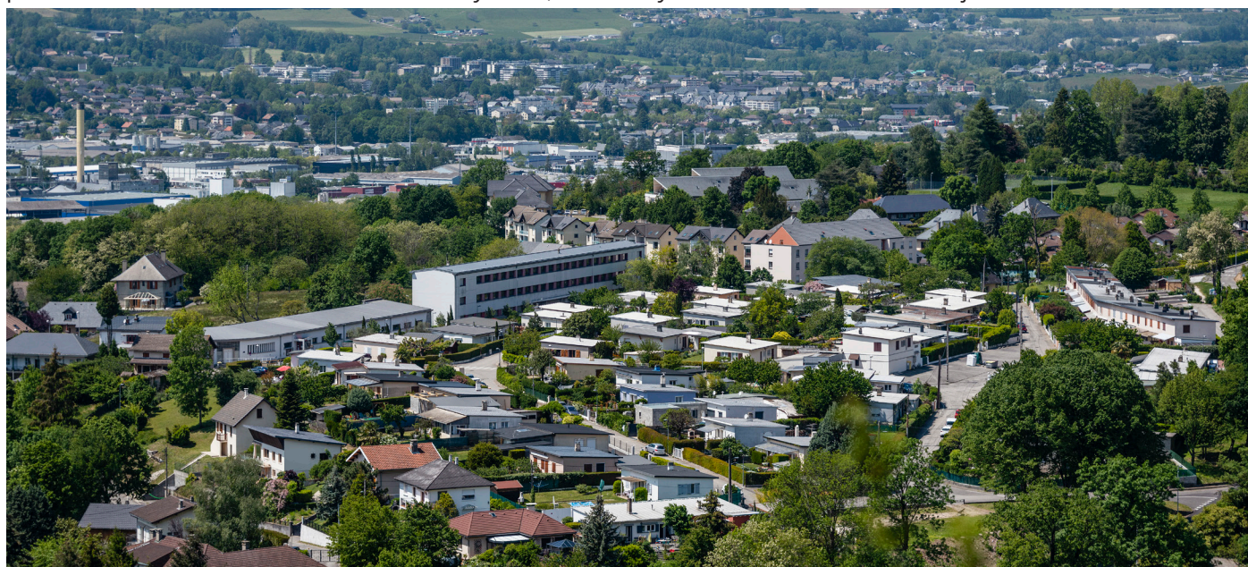
Vue de Chambéry depuis le Piochet

Sur le plan de la validation, huit comités de pilotage ont permis la validation des propositions et un comité syndical d'arrêt du SCoT le 29 juin 2019.