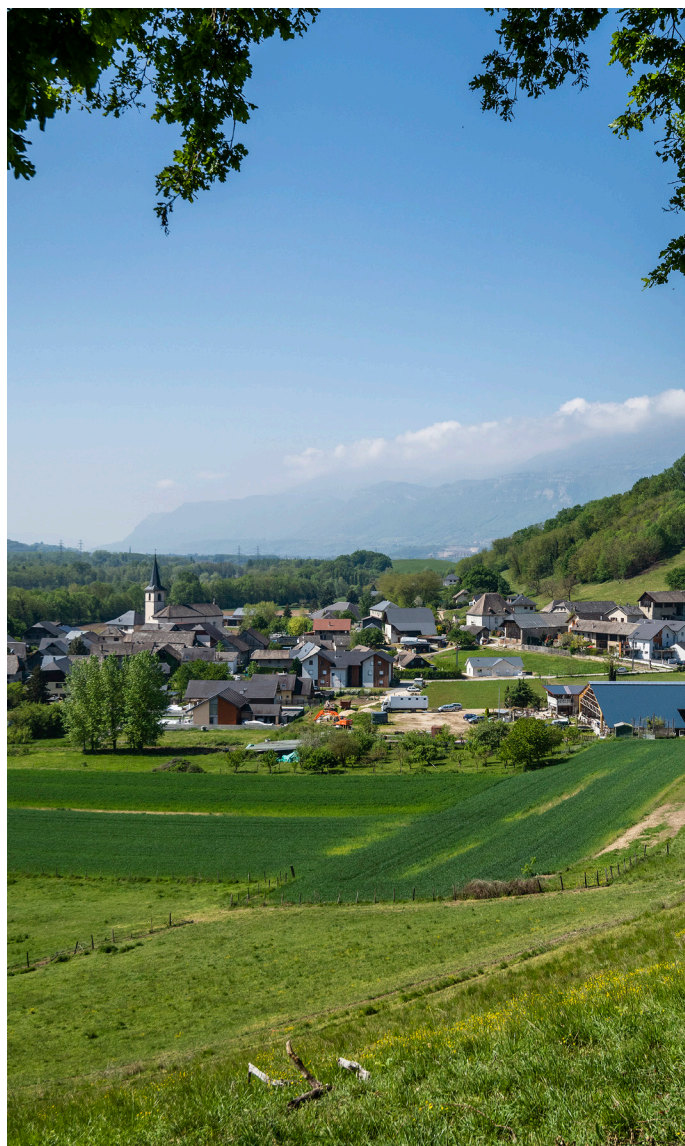
Sainte-Hélène du Lac