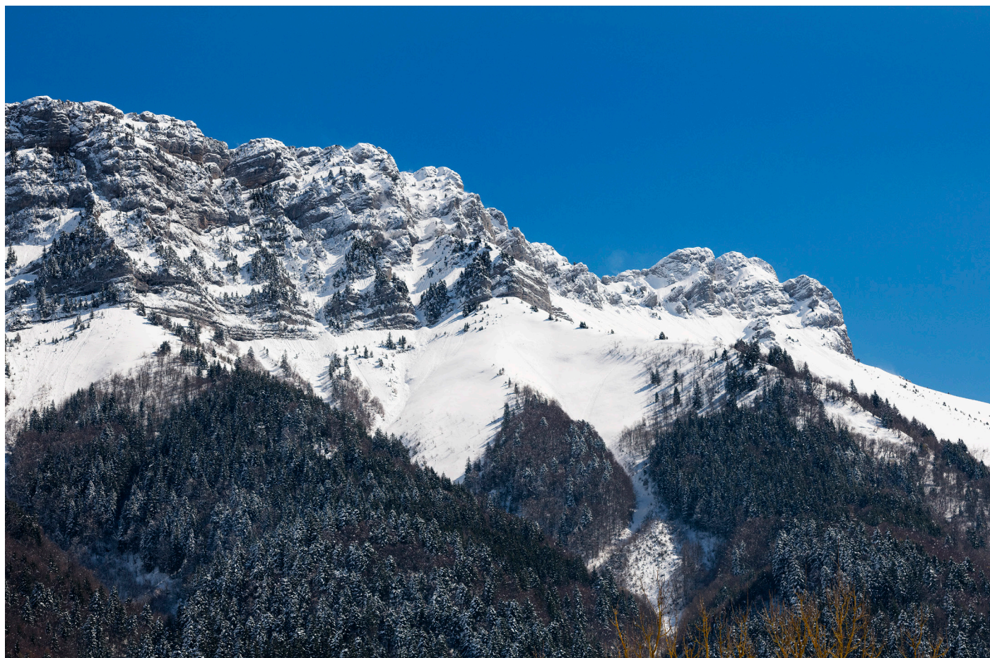
Bauges - Dent d'Arclusaz