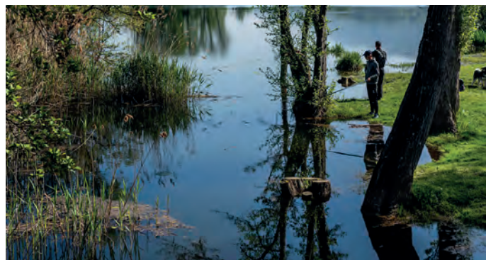
Lac Sainte-Hélène-du-Lac

Le SCoT vise à engendrer une démarche active de promotion de la biodiversité dans les projets d'aménagement pouvant aller notamment vers des mesures de remise en bon état des continuités écologiques.