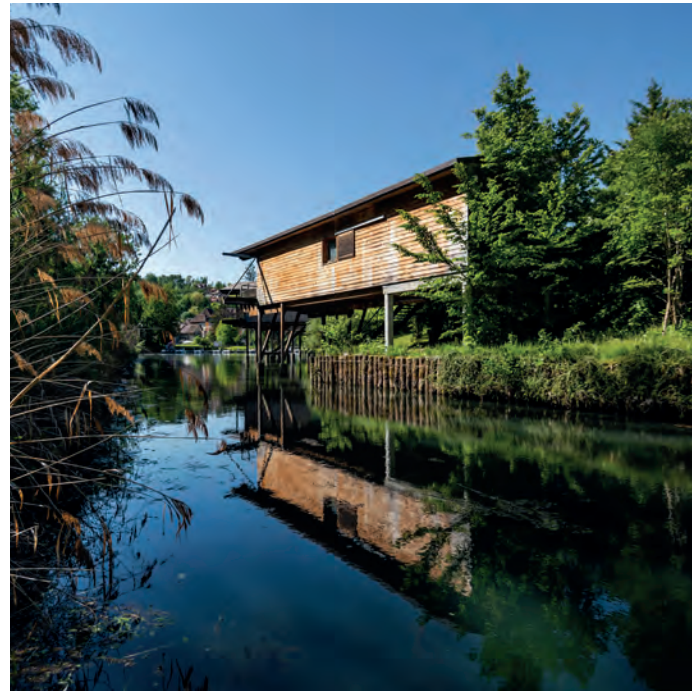
Camping des îles à Chanaz

ainsi que l'offre d'activités de nature et de loisirs qui ponctue l'ensemble du territoire de manière diffuse.