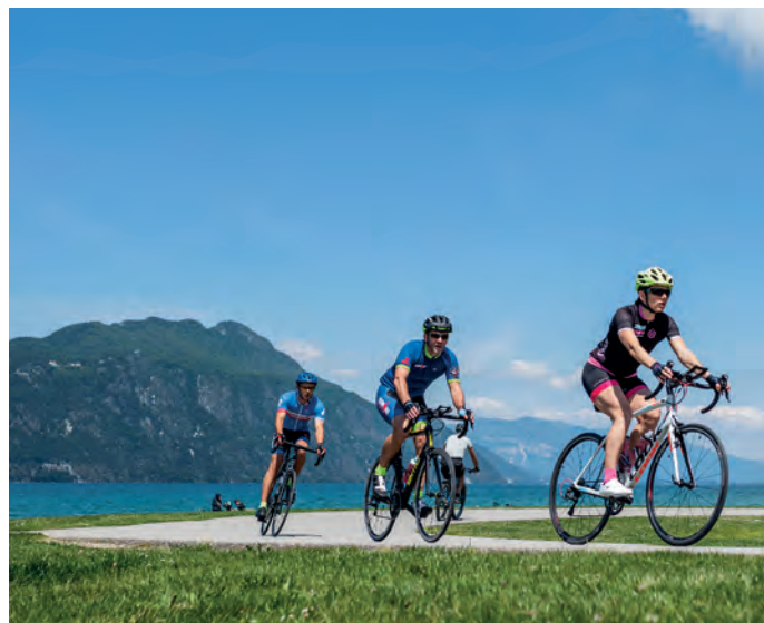
Voie verte le long du Lac du Bourget

Le territoire jouit cependant d'une proximité intéressante entre les grands centres urbains pourvoyeurs de solutions multiples de transport et les principaux lieux de visite et d'activités touristiques. Le SCoT vise à tirer profit de cette proximité en continuant à développer des solutions de transports adaptées aux flux touristiques depuis ces grands centres urbains au travers par exemple, d'une adaptation de l'offre de transports vers les Parcs Naturels des Bauges et de Chartreuse en haute saison, du développement des infrastructures de mobilité douce, ou encore du développement de navettes fluviales sur le lac du Bourget, etc.