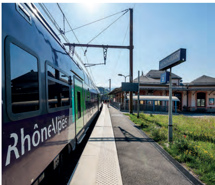
Gare ferroviaire de Montmélian