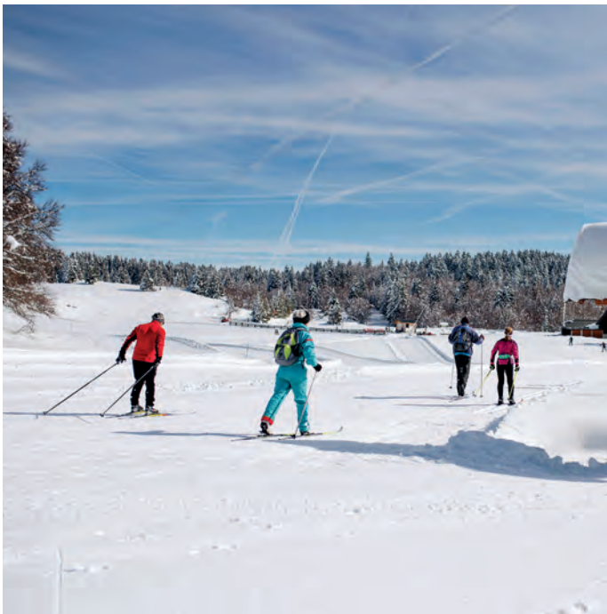
Station de La Féclaz