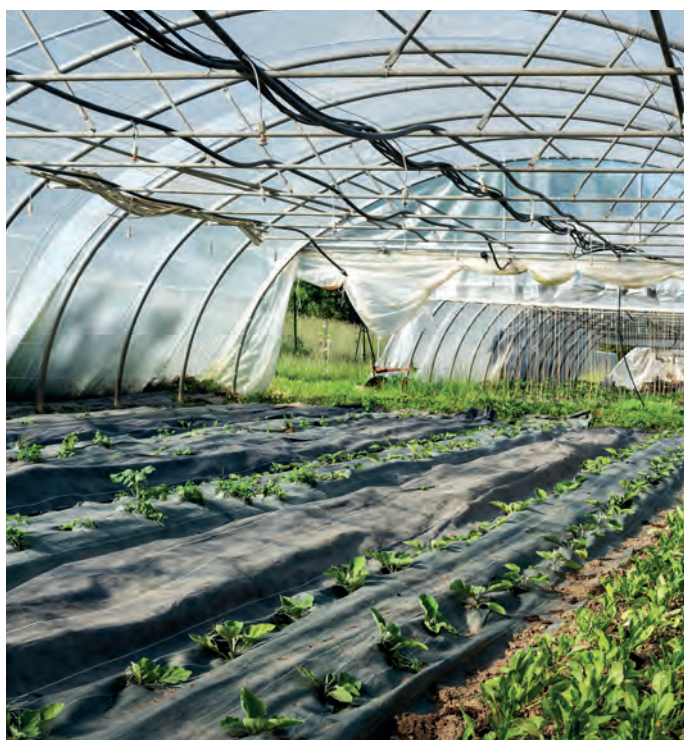
Ferme «les mauvaises graines» à Arvillard

Pour que les espaces urbains participent pleinement à la qualité et à la richesse du paysage de Métropole Savoie, le SCoT vise à ce que, dans le cadre de nouveaux projets de développement ou de renouvellement urbain, une attention particulière soit accordée aux aspects, paysagers architecturaux et urbanistiques.