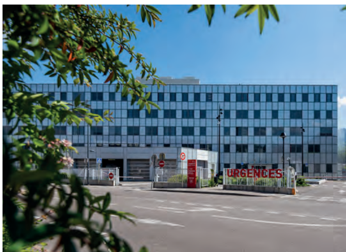
Centre Hospitalier Métropole Savoie - Chambéry

à chacun des niveaux d'armature territoriale, tout en tenant compte des évolutions rapides à attendre sur ce sujet en lien avec les nouveaux usages, l'évolution des services numériques, le recours croissant à l'intelligence artificielle, etc.