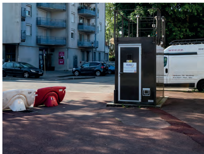
Capteur ATMO à Chambéry