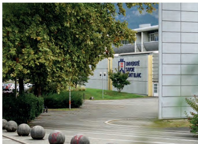
Université de Savoie - Savoie Technolac

Métropole Savoie est un territoire qui se caractérise par une forte mobilité interne des actifs avec une grande dépendance à l'utilisation de la voiture. Les actifs occupés résidant sur Métropole Savoie parcourent en moyenne 30 km pour aller et venir sur leur lieu de travail, ce parcours quotidien dure en moyenne 40 minutes. La réduction de ce recours passe nécessairement par le développement des modes de transport alternatifs à la voiture mais aussi par la conception de centralités dynamiques, dans les territoires urbains de plaine comme dans les territoires ruraux de montagne, articulant des fonctions résidentielles et économiques tertiaires et des services adaptés aux besoins, afin de réduire autant que faire se peut le recours à la mobilité motorisée dans les usages du quotidien.