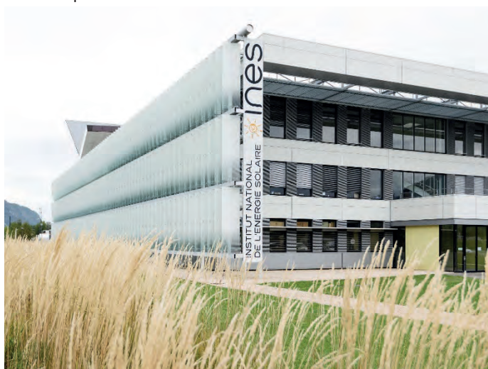
INES à Savoie Technolac