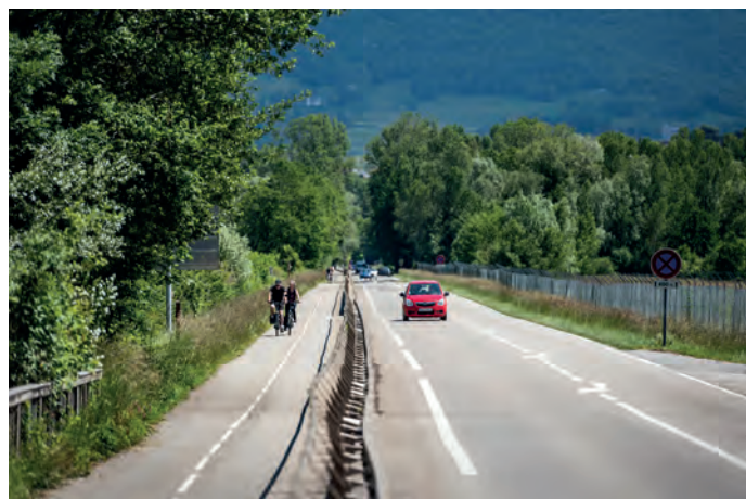
Piste cyclable Le Bourget du Lac