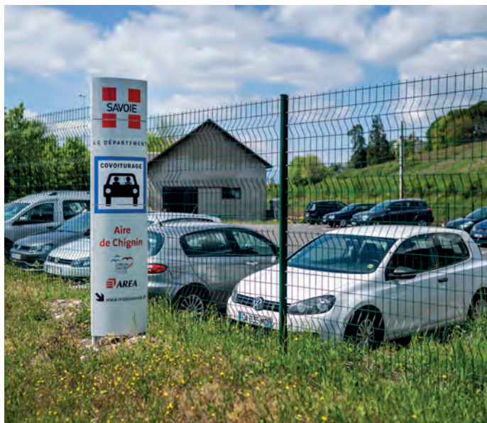
Aire de covoiturage - Chignin