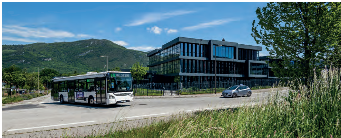
Parc d'activités les Massettes à Challes-les-Eaux

Le SCoT vise à inscrire une gestion fine et équilibrée du foncier économique, facilitatrice du développement économique et porteuse d'équité territoriale. La coopération existante entre les territoires sur la définition de cette stratégie nécessite d'être poursuivie et renforcée. La définition de cette stratégie doit être attentive à la prise en compte des besoins actuels et futurs des entreprises, aux leviers de différenciation et de compétitivité de l'offre foncière et immobilière par rapport à l'offre des territoires voisins, à la lisibilité des espaces et des spécialités, à la spatialisation équilibrée des activités entre le Nord, le Centre et le Sud afin de concourir à ce que la dynamique d'emploi se réalise de manière homogène sur l'ensemble du territoire. Les secteurs ruraux et de montagne ne doivent pas être en reste de cette stratégie. Il convient pour ces espaces, de prévoir les conditions nécessaires à l'installation et au développement des activités artisanales et de services en priorisant toujours le renouvellement, la densification des espaces existants sur la création de nouveaux espaces.