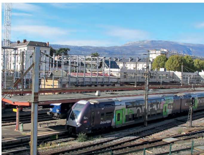
Gare ferroviaire de Chambéry