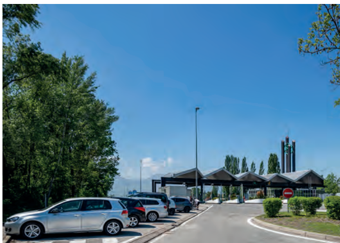
Parking relais péage autoroute Montmélian

la sécurisation des itinéraires vélo tant pour les déplacements de proximité (centres villages/périphérie immédiate) qu'à l'échelle du territoire de Métropole Savoie.