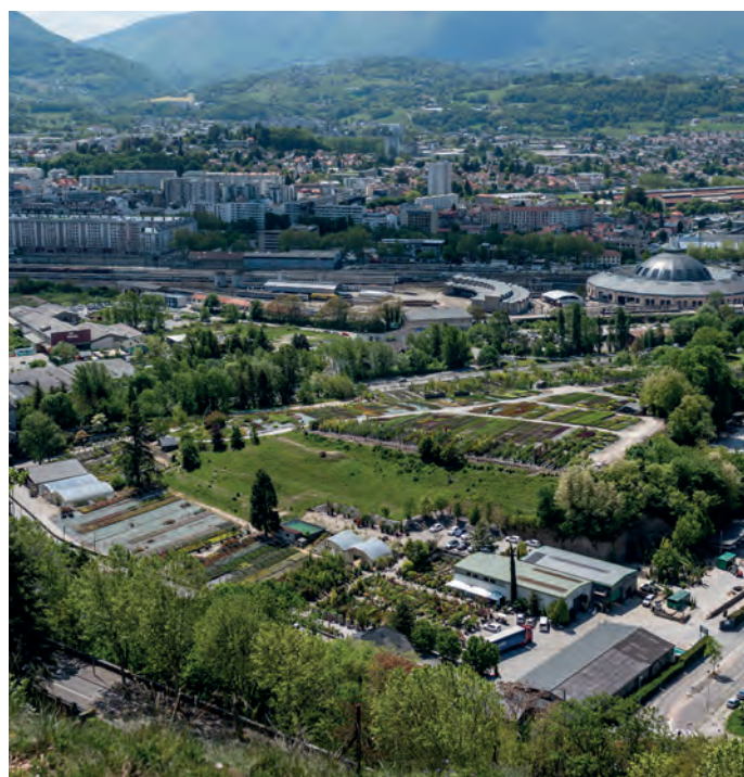
Friche de la Cassine à Chambéry

au sein des tissus urbanisés et/ou à proximité des infrastructures de transport.