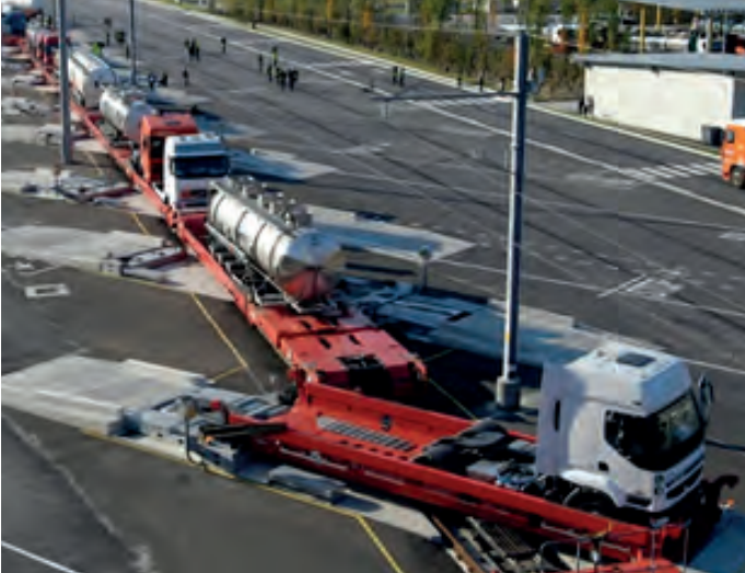
Plateforme de ferroutage - Via Connect Bourgneuf-Aiton