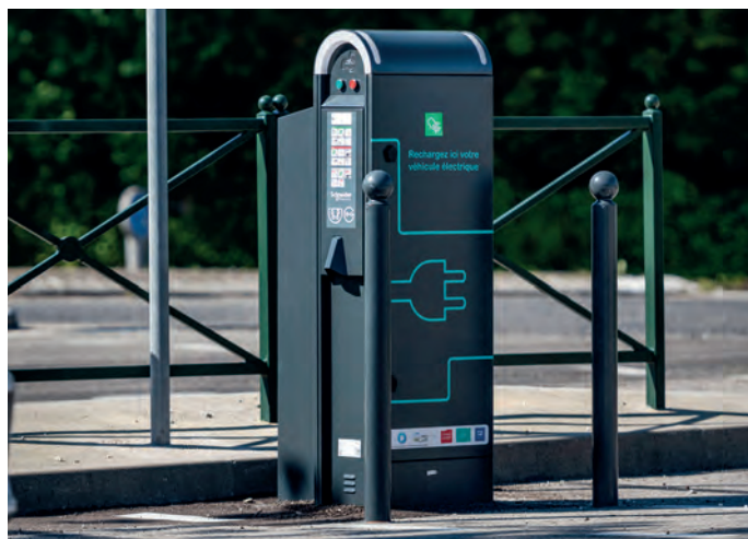
Borne de recharge véhicule électrique - La Trousse à Chambéry

et la réhabilitation des bâtiments Promouvoir le développement de systèmes de production d'énergies renouvelables sur le territoire en encourageant le développement des filières existantes (bois-énergie, solaire, géothermie, ...) et en devenir (biogaz, hydrogène, ...) et en permettant toute innovation (stockage de l'énergie, ...). Dans un souci d'économie de foncier, la production d'énergie renouvelable, lorsqu'elle n'est pas directement liée à l'usage d'un bâtiment, sera privilégiée sur des secteurs artificialisés (délaissés de terrain, parkings par exemple) ou ayant déjà un usage identifié (toitures de bâtiments par exemple).