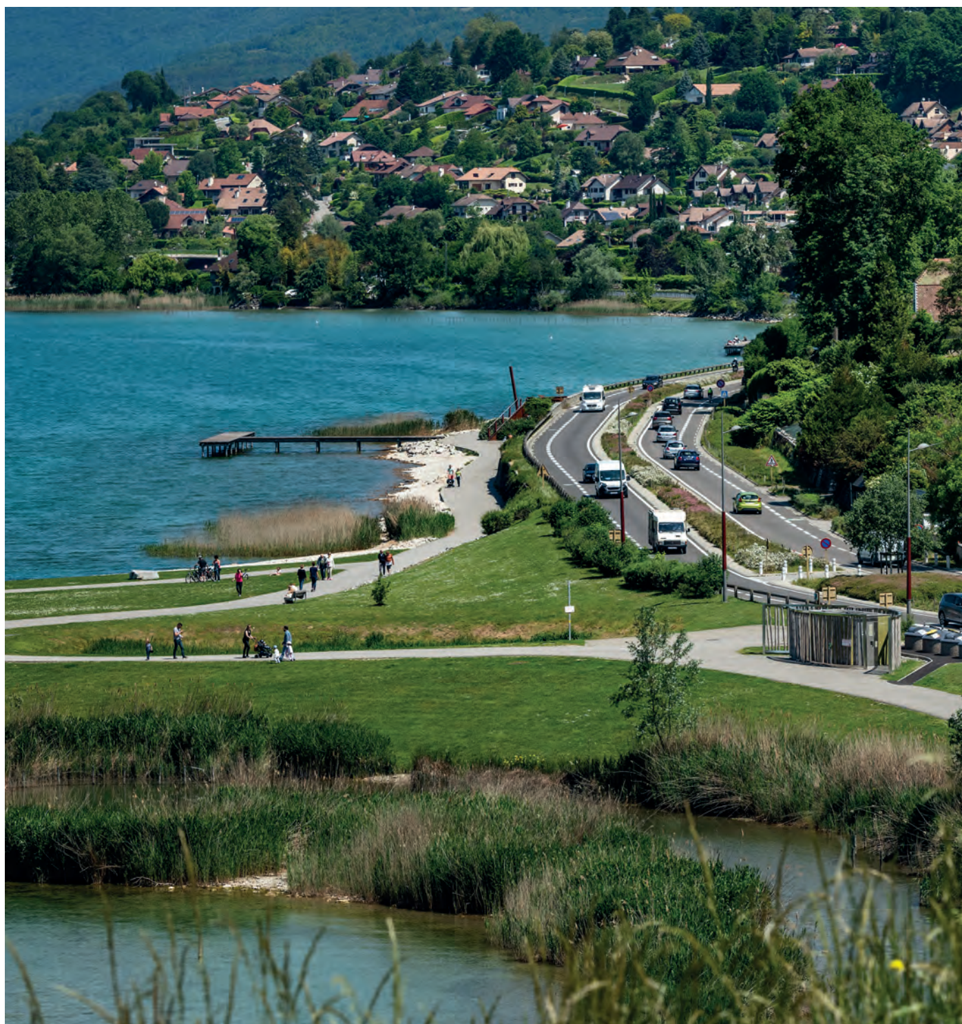
En bordure du Lac du Bourget

Le SCoT vise à organiser le développement des espaces soumis à la loi littoral afin de préserver cette ressource et ses bienfaits pour le territoire.