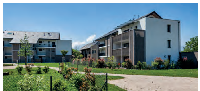
Habitat La Chavanne

Pour répondre à la diversité des besoins des ménages, le SCoT fixe un objectif de logement locatif social et d'accession abordable sur l'ensemble du territoire.