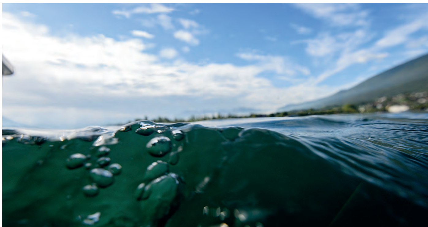
Lac du Bourget

Le SCoT vise à ce que la ressource en eau soit bien partagée à terme sur l'ensemble du territoire et pour tous les usages, notamment entre les habitants et l'irrigation agricole (qui est susceptible de se démultiplier en raison d'étés plus secs).