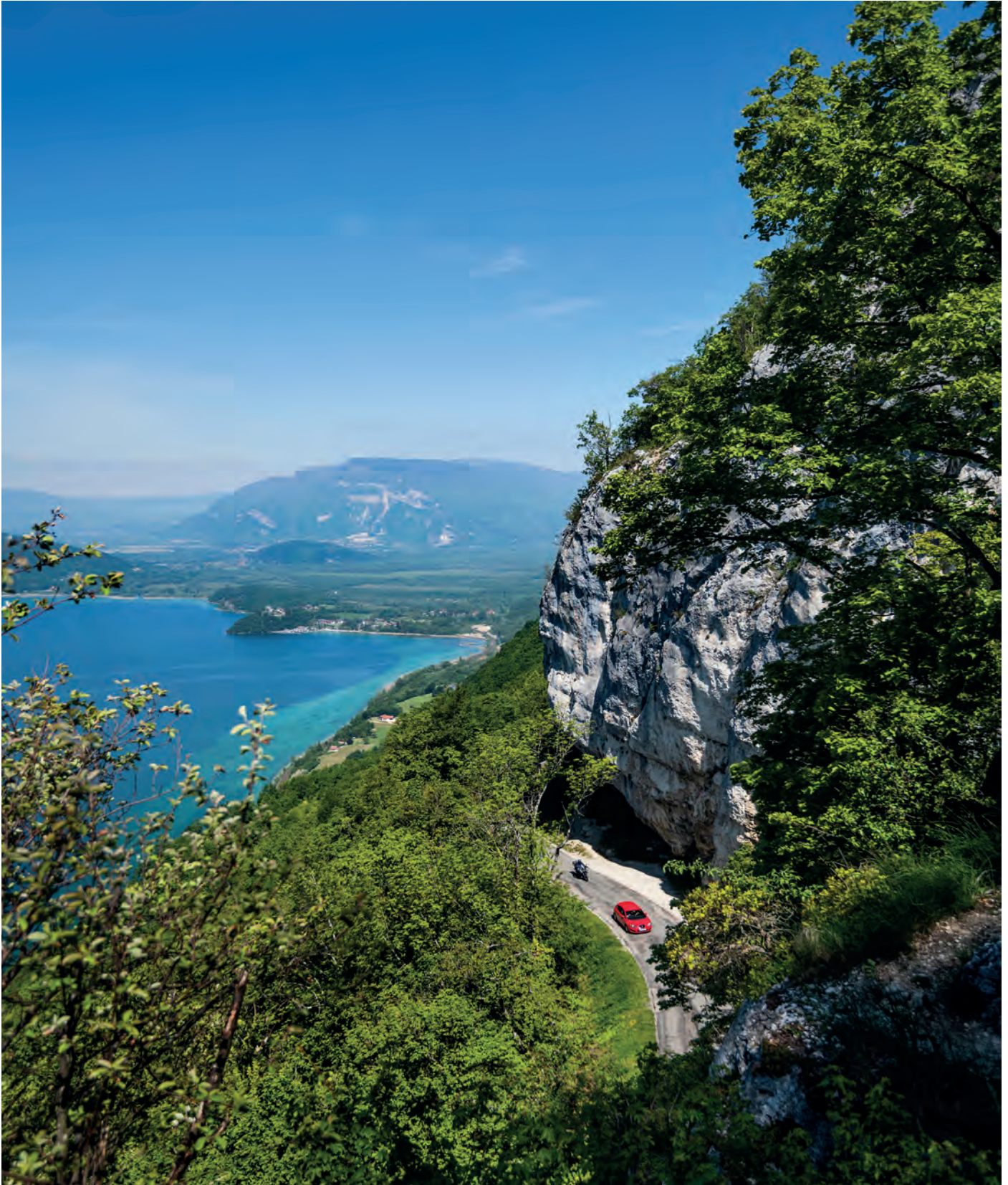
Vue du Lac du Bourget depuis le col de la Chambotte