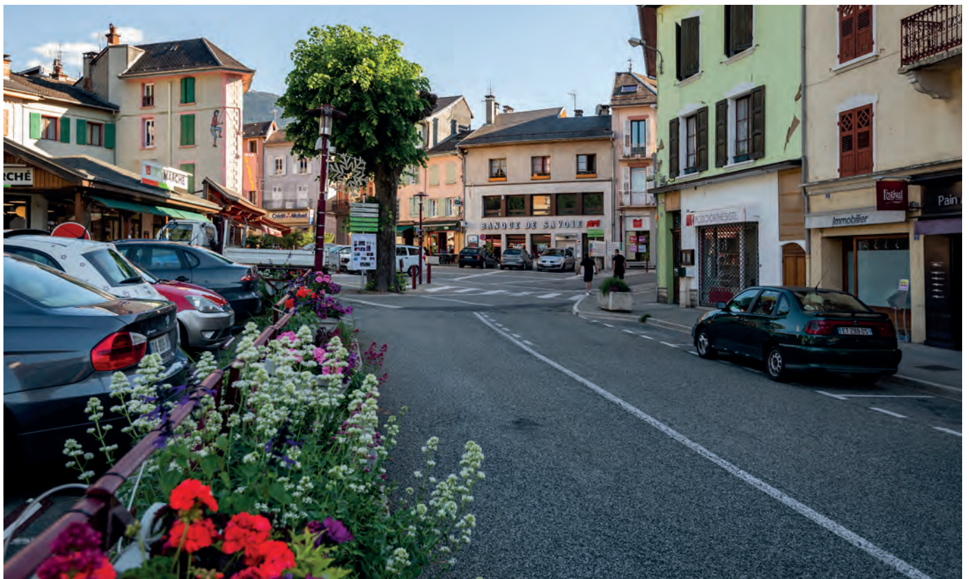
Centre bourg Valgelon-La Rochette

La reconfiguration partielle ou totale des zones commerciales en quartiers urbains mixtes quand leur